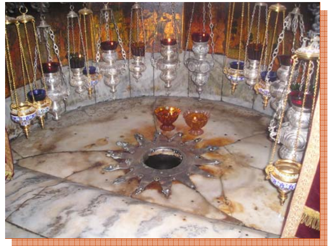
Betlehem – miesto Ježišovho narodenia

V posolstve z 25.12.2008 nás Panna Mária pozvala k modlitbe, aby sa Ježiš mohol narodiť v našom srdci. V tomto posolstve môžeme cítiť smutnú výčitku Jej srdca, pretože sme neuposlúchli jej výzvu. Z tohto posolstva akoby sme čítali smutnú výčitku v Jej srdci kvôli tomu, že sme ju neposlúchli. „Ponáhľate sa, pracujete, zhromažďujete, ale bez požehnania“ – hovorí nám Matka Mária. Vždy bola pre mňa v Medžugoríí obrazná skúsenosť výstupu na kopec zjavenia. Začínajúc výstup z jednej i druhej strany cesty sa vedľa seba nachádzajú malé obchodíky s nespočtelným počtom náboženských suvenírov a predmetov. Keď človek vystúpi z toho „lesa“ suvenírov a vystupuje pomaličky vyššie, cíti akoby začal ľahšie dýchať. Uprostred tohto množstva vecí človek cíti, akoby mu bránili dýchať. V tom zhone za lepšou výpalatou, konkurenciou človek ľahko stratí ukazovatele k životu. Panna Mária nám ukázala cestu k životu cez jednoduchosť cesty, na ktorej sa nachádzajú holé kamenie. Tu na kopci k nám prišla matka Mária s dieťaťom Ježišom v náručí. Nič dôležitejšie ani potrebnéjšie ako je Ježiš nám nemohla dať.