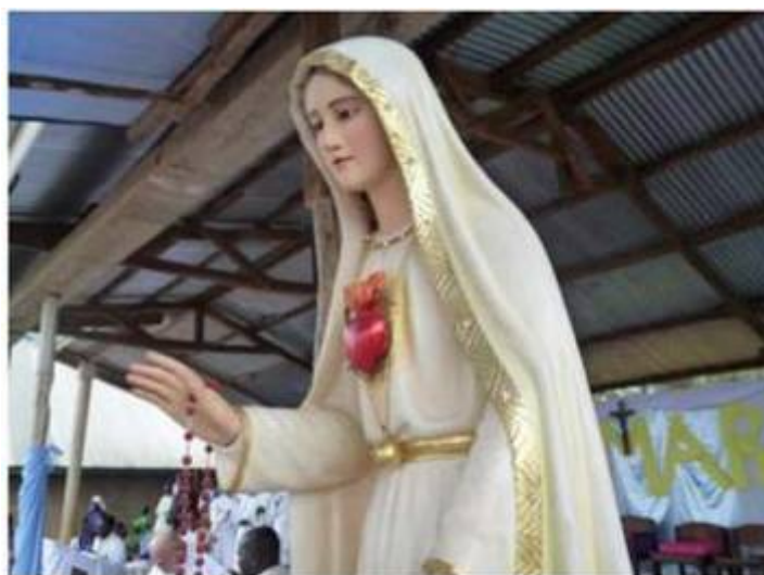
Fatimská Panna Mária putuje v Kongu, Rwande a Burundi aby priniesla pokoj (mier) po 15 rokoch vojny

Zasväcujme sa s dôverou Nepoškvrnenému Srdcu Panny Márie, naše rodiny, spoločnosti, tento svet, modlíme sa za pokoj. (Viac informácií nájdete na http://www.maria.sk/index.php?link=vita&sublink=mier. )